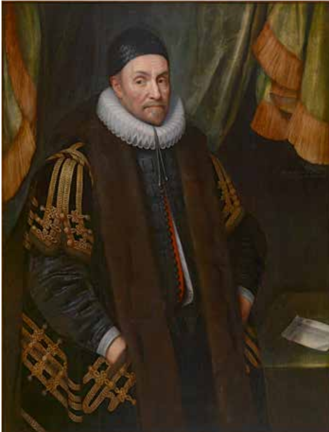
Portret van Willem van Oranje | ca. 1622 Michiel van Mierevelt (1566-1641) olieverf op paneel Collectie Museum Prinsenhof Delft | PDS 68a