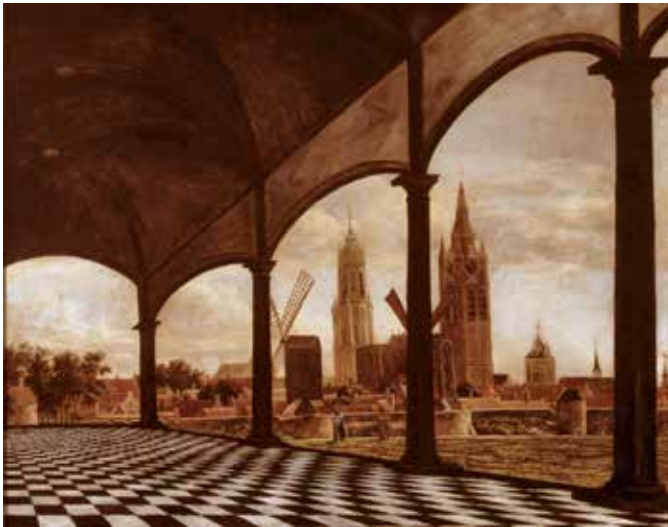
Gezicht op Delft vanuit een fantasie loggia | 1663 Daniël Vosmaer (1622-circa 1666) olieverf op doek Collectie Museum Prinsenhof Delft Bruikleen Rijksdienst voor het Cultureel Erfgoed | B 1-36