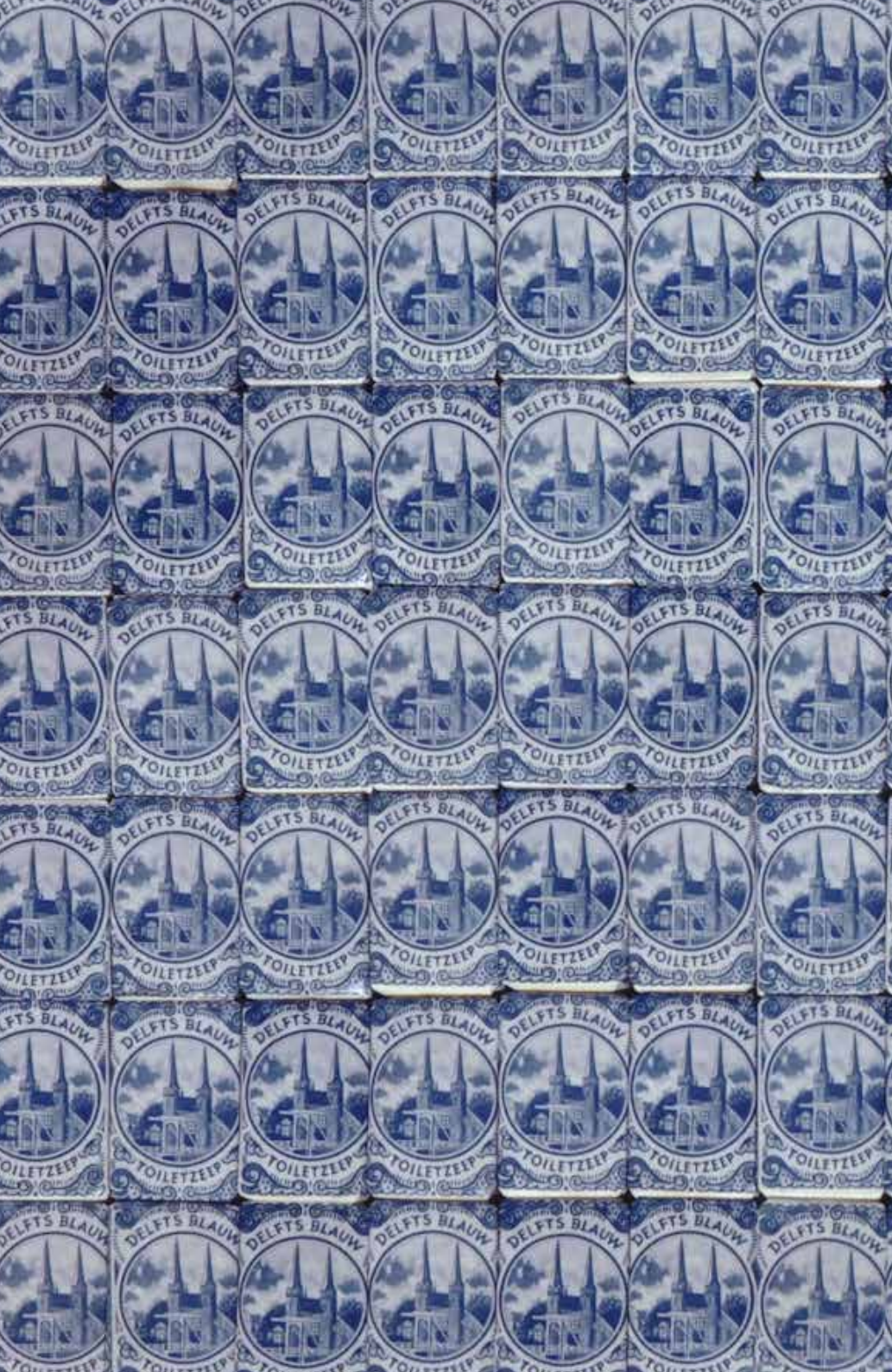
Twin Towers Delft | 2002, Jan Henderikse, mixed media | PDMK 1627