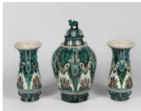
"Kamelenvaas" Nieuw Delfts, Kaststel | 1910 - 1929