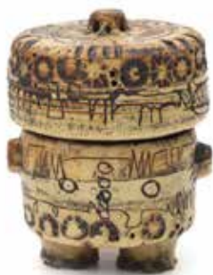
Dekselpot | 1963 - 1967