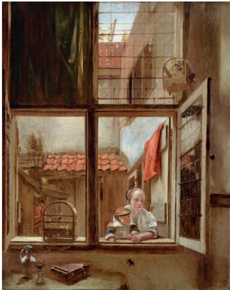
Moeder en kind aan het venster | ca. 1650 Hendrick van der Burgh Collectie Museum Prinsenhof Delft