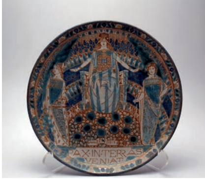
Herinneringsschotel ter gelegenheid van de opening van het Vredespaleis | 1913 Anoniem Collectie Museum Prinsenhof Delft Verworven met steun van Vereniging Rembrandt