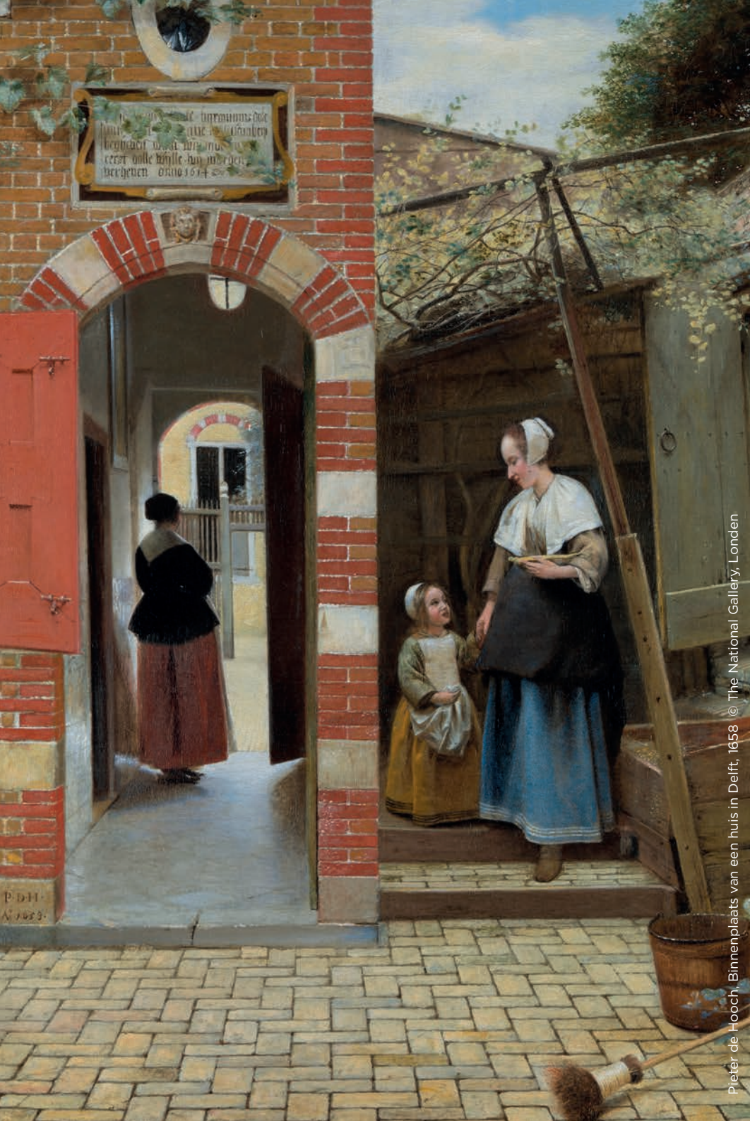
Pieter de Hooch, Binnenplaats van een huis in Delft, 1658.