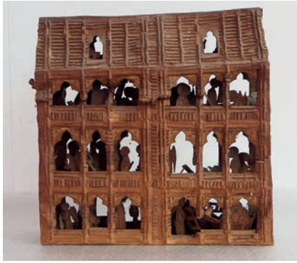
Apostelhuis | ca. 1955 Jan Schoonhoven Collectie Museum Prinsenhof Delft