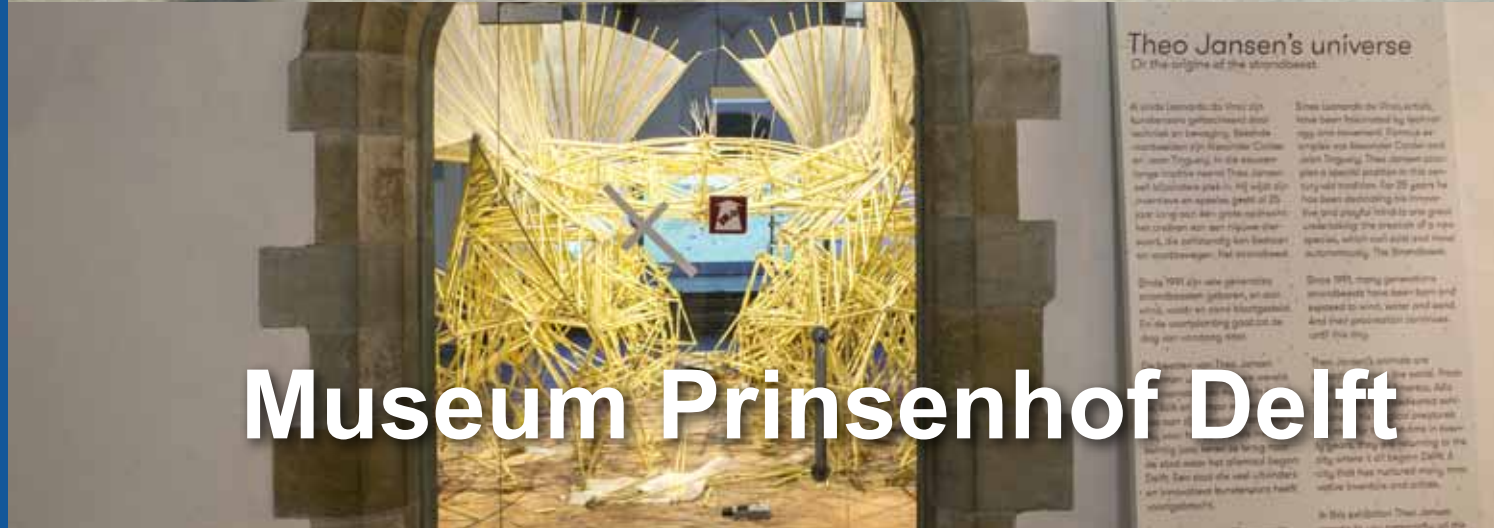
Museum Prinsenhof Delft