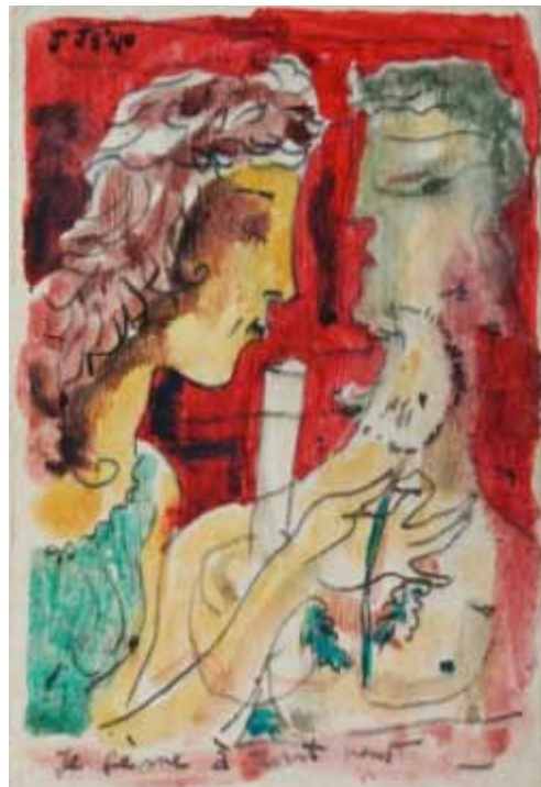
links Je sème à tout vent | 1940 Jan Schoonhoven papier | PDT 1296

Op de tentoonstelling Kijk, Jan Schoonhoven waren naast stukken uit de eigen collectie ook diverse bruiklenen uit museale en particuliere collecties te zien. Een bijzondere groep vroege tekeningen van Schoonhoven kon het museum na de tentoonstelling aankopen van de particuliere eigenaar. In totaal gaat het om 16 tekeningen en 1 ex libris uit de periode 1938-1941. Met de verwerving van deze werken kan het museum een completer beeld geven van het oeuvre van Schoonhoven. De werken tonen enerzijds Schoonhovens religieuze interesse en anderzijds een zoekende kunstenaar, die zich nog door andere kunstenaars en stijlen laat inspireren.