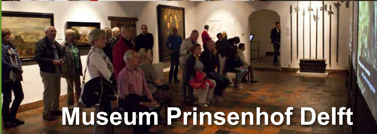
Museum Prinsenhof Delft