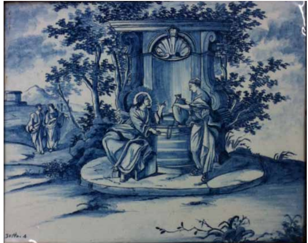
plaque | 1750 Jezus en de Samaritaanse vrouw. Collectie Museum Prinsenhof, Delft | PDA 1198