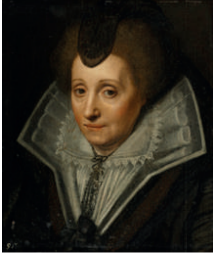
Michiel van Mierevelt, Portret van Louise de Coligny, 1610 - 1620, olieverf op paneel, Collectie Museum Prinsenhof Delft.