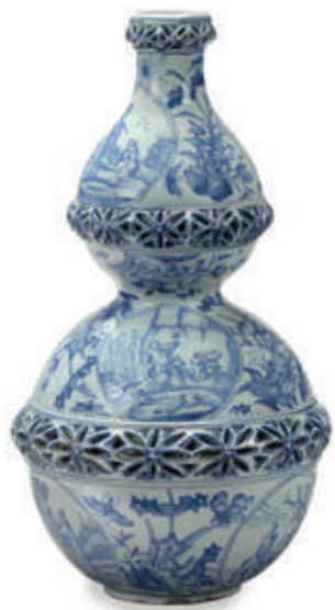
Onbekende plateelbakkerij, naar Leonaert Bramer, Vaas met Bijbelse voorstellingen, 1660-1670, tinglazuuraardewerk, Collectie Museum Prinsenhof Delft.