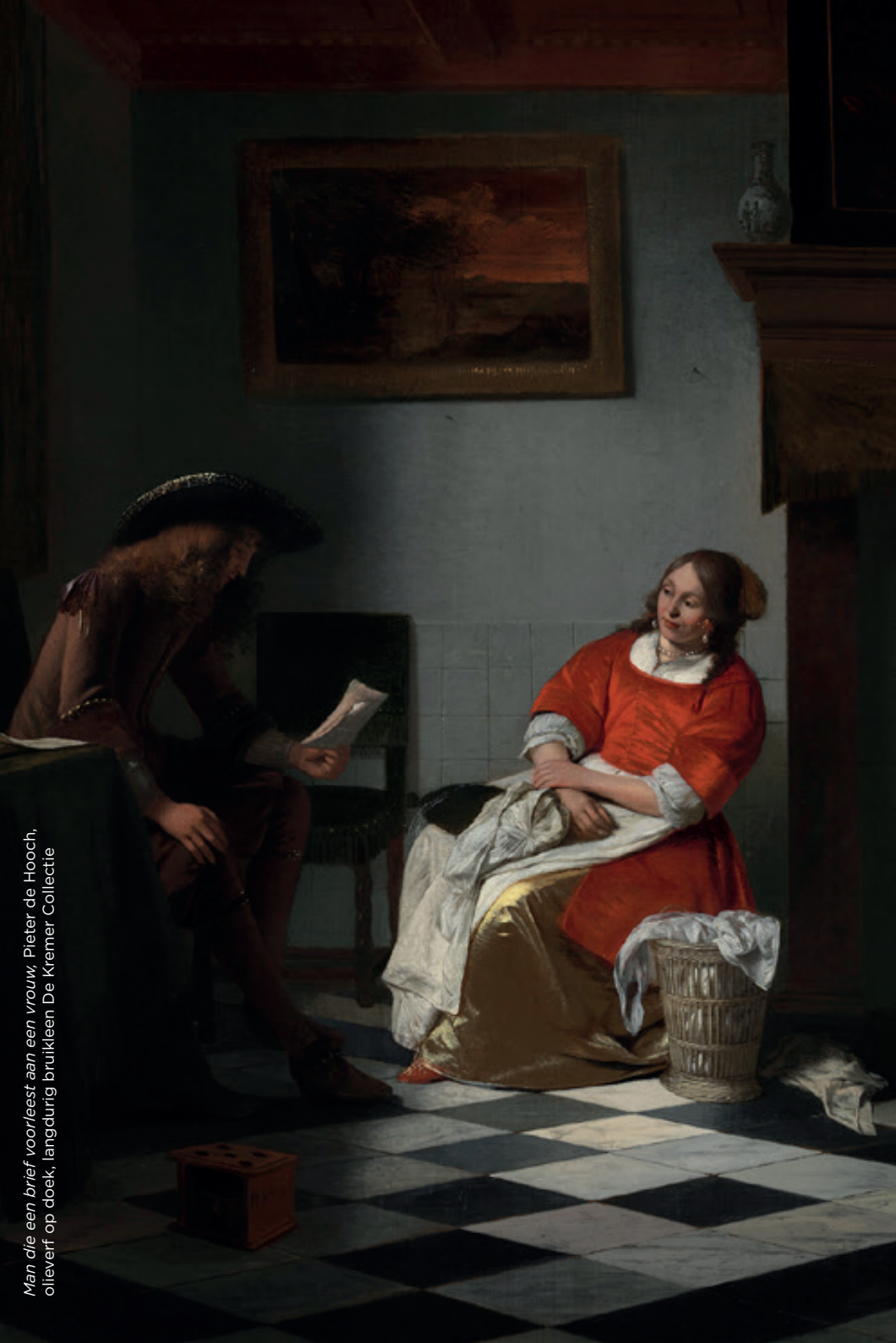
Man die een brief voorleest aan een vrouw, Pieter de Hooch, olieverf op doek, langdurig bruikleen De Kremer Collectie