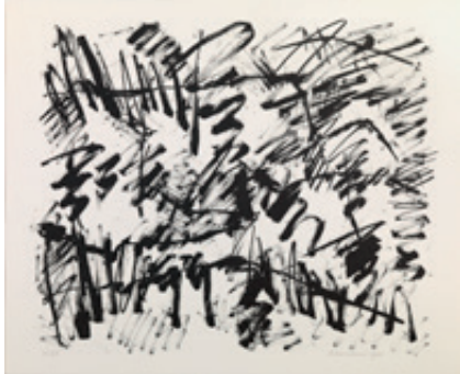
Lithografie, Jan Schoonhoven, 1988, papier, Collectie Museum Prinsenhof Delft, schenking anoniem